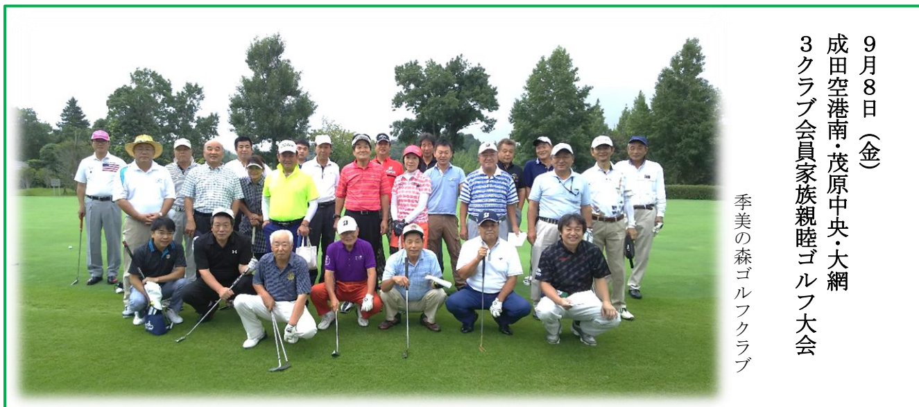
季美の森ゴルフクラブ