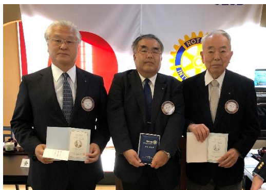
富会員/市原会員/青柳会員